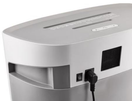
Skartovač DAHLE PaperSAFE® 380