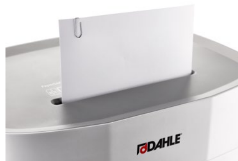
Skartovač DAHLE PaperSAFE® 380