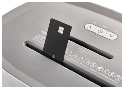
Skartovač DAHLE PaperSAFE® 380