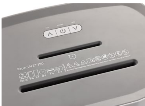
Skartovač DAHLE PaperSAFE® 380